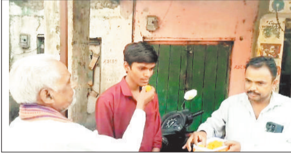
छात्र को मिठाई खिलाई खिलाकर बधाई देते परिजन।