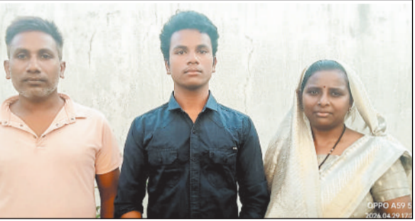
परिजन के साथ खड़ा छात्र।