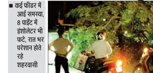
तापमान में गिरावट आए, वहीं बिजली आपूर्ति बाधित होने की वजह से शहरवासियों को परेशानी उठानी पड़ी। शहर में हर तरफ पेड़ के

रायगढ़। मंगलवार की रात तेज आंधी तूफान के साथ आधे घंटे की बारिश की वजह से पूरा शहर ब्लैक आउट हो गया। आलम यह रहा कि पूरे शहर में बिजली आपूर्ति करीब 5 से 7 घंटे तक बाधित रही। बारिश और गाज के कारण करीब 7 से 8 पॉइंट में इंशोलेटर भी भंग हो गए और करीब 15 से 20 पोल क्षतिग्रस्त हो गए, ऐसे में इन इलाकों में बिजली आपूर्ति बहाल करने में ज्यादा समय लग गया। जिसकी वजह से शहरवासियों को काफी परेशानी उठानी पड़ी। रात को हुई बारिश के कारण एक ओर जहां